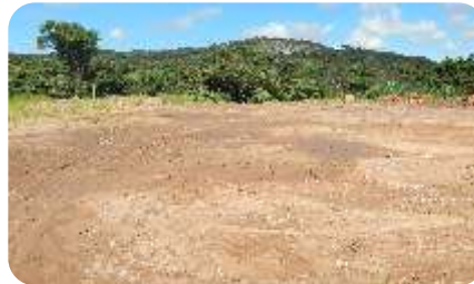
Terreno doado pela prefeitura de Itaúna, em 15 de dezembro de 2015, para a construção do CIEMA.

Enfim, o CIEMA pertence a cada APAC e cada apaqueano é convidado a tomar esta obra como sua. Convidamos todos para se inteirar sobre ela, participando e contribuindo com sua execução.