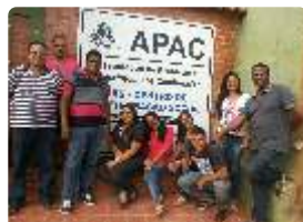
APAC de Salinas Novos funcionários