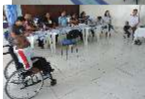
Trinta e cinco funcionários das novas APACs participaram do treinamento realizado pela FBAC, na APAC de Itaúna, dos dias 15 a 17 de Fevereiro de 2016. Participaram também funcionários da APAC de Itaúna e da APAC feminina de São João del Rei.