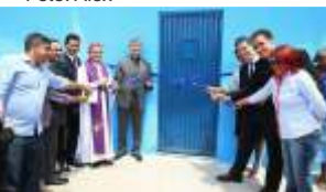
Inauguração do CRS da APAC de Timon/MA