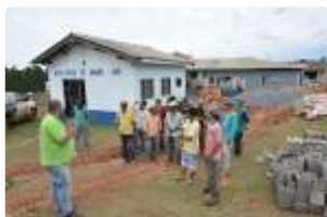
Construção do CRS APAC de Patos de Minas