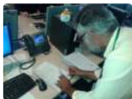
O presidente da APAC de Timóteo, durante assinatura do convênio.

Cinco novos Centros de Reintegração Social - CRS - foram inaugurados. Já estavam em construção e terminaram as obras ao final do ano de 2015. Neste início de 2016, estabeleceram convênios de custeio e estão recebendo os primeiros recuperandos. São eles: Araxá/MG, Patos de Minas/MG, Timóteo/MG, Salinas/MG e Timon/MA.