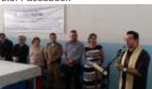
Bênção da APAC de Araxá